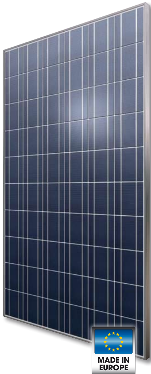
Fig. similaire 60P156FR1 10201E