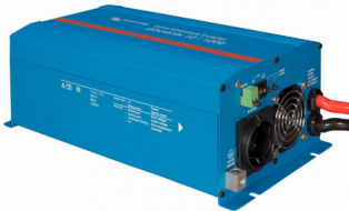
Phoenix Inverter 12/800 with Schuko socket