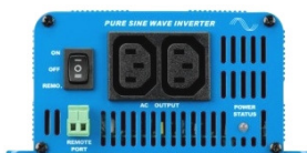
Phoenix Inverter 12/350 with IEC-320 sockets

Un connecteur pour un interrupteur marche-arrêt à distance est disponible sur tous les modèles.