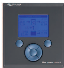
Tableau de contrôle Blue Power

Un solution pratique et bon marché pour une surveillance à distance, avec un bouton rotatif pour configurer les niveaux de Power Control et Power Assist.