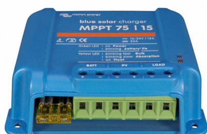
Contrôleur de charge solaire MPPT 75/15